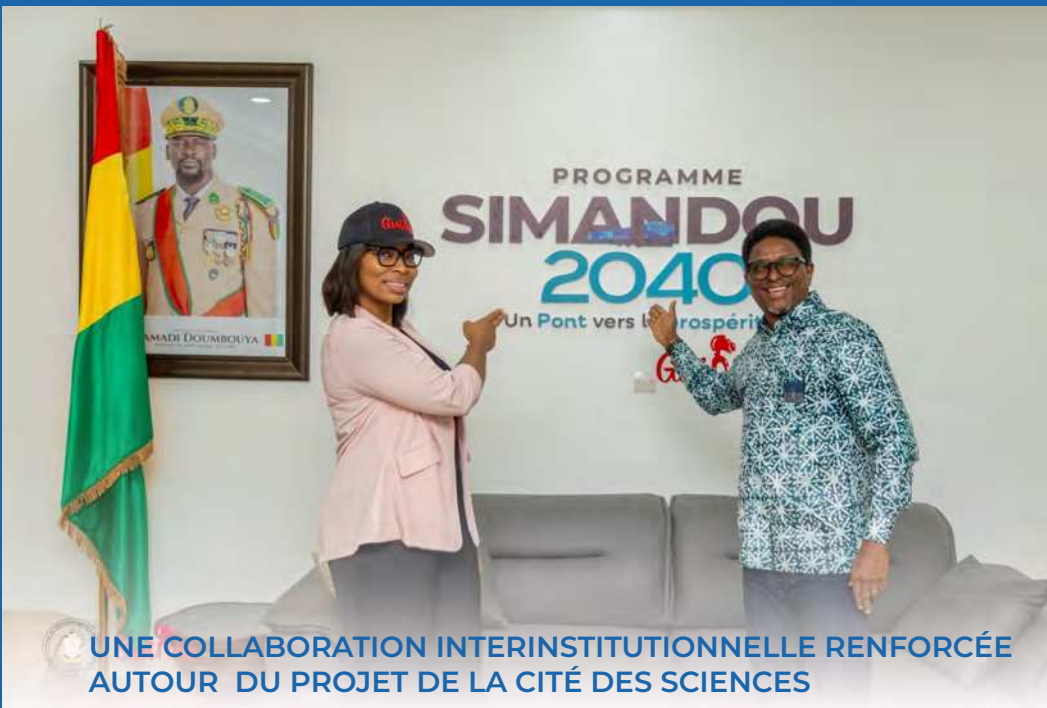
UNE COLLABORATION INTERINSTITUTIONNELLE RENFORCÉE AUTOUR DU PROJET DE LA CITÉ DES SCIENCES